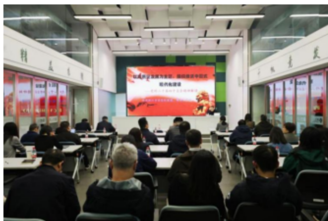
集团党委举办学习贯彻党的二十届四中全会和省委十五届八次全会精神专题培训班

现场教学、媒体宣传等多种形式全覆盖推进。集团领导面向企业党员、群众开展全会精神宣讲，带队开展全会精神专题学习巡听旁听，持续推动全会精神到基层、进一线。集团党委举办学习贯彻党的二十届四中全会和省委十五届八次全会精神专题培训班，组织党员干部走进中国（杭州）人工智能小镇参观学习，依托“一网一号一刊”扩大宣传声势，在集团微信公众号开辟多个专栏，推动全会精神落地见效。