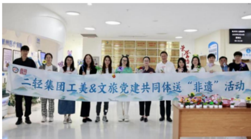
集团工美文旅党建共同体开展非遗进院区活动