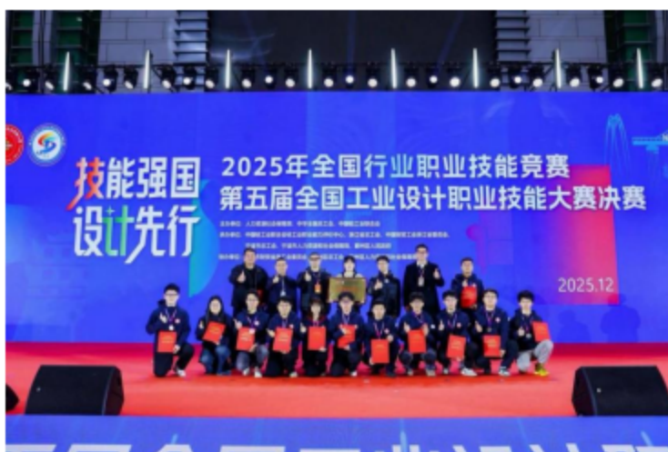
2025 年全国行业职业技能竞赛浙江代表队

搭建行业交流平台，举办全省历史经典产业高质量发展论文赛、工美 AI 创意设计大赛；联合省人社厅、省总工会成功举办 2025 年度浙江省工业设计职业技能竞赛暨全国大赛选拔赛，选拔推荐的浙江代表队 17 名选手在全国大赛中斩获奖项，集团荣获“优秀组织单位”称号，以赛促学、以赛促建，有效激发工美技能人才创新创业活力。