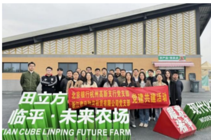
二轻租赁公司党支部与北京银行杭州高新支行党支部开展 “科技助农促振兴 创新驱动谋发展”党建联建

坚持外拓资源促发展，集团党委与省属企业、地方政府及高校签订战略合作协议，聚集近百家产业链上下游单位成立浙江省船舶产业技术创新联盟，各所属党组织紧紧围绕产业链强链、延链、补链关键任务，深入开展产业链上下游党建联建活动，以党建链串联赋能产业链、创新链，不断激活产业协同发展新动能。