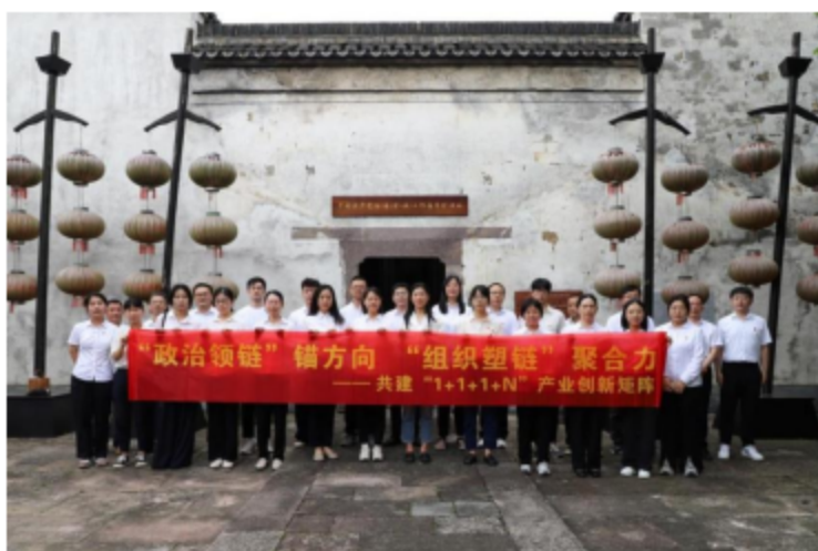
集团“1+1+1+N”党建共同体参观中共临余工委旧址纪念馆

坚持内聚合力强协同，集团党委聚焦工美文化、智能船舶等核心主业应用场景，成立工艺美术、智能船舶等5个领域“党建共同体”，推动成员单位资源共享互通、联合招商引企、联办党建活动、协同科研攻关，实现多方联动助力浙江省智能船舶创新中心招商引智，以“进院区、进校园、进机场”系列行动弘扬浙派工美文化，为集团高质量发展注入强劲“红色动能”。