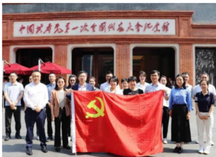
广杰典当公司联合党支部与财通基金第四党支部开展“寻根溯源担使命 党建联建聚合力”党建联建