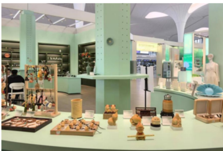
萧山机场窗口展销永嘉特色产品