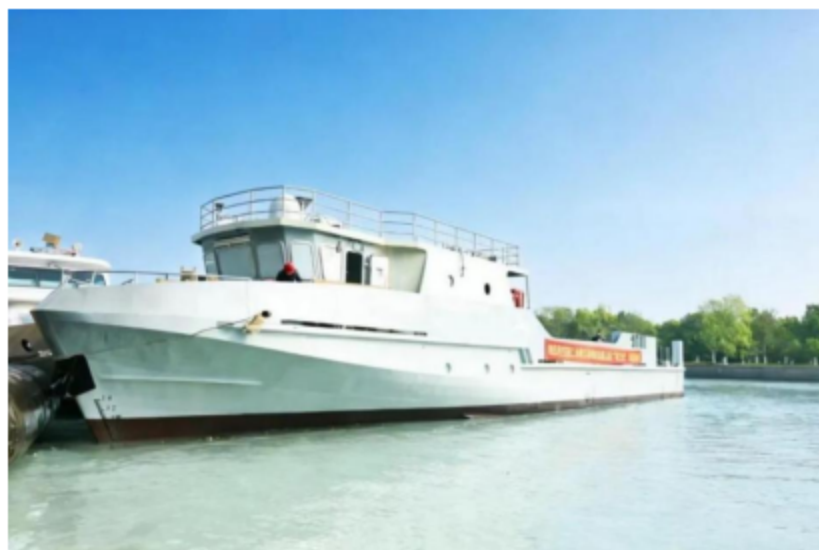
百吨级海上通用无人船