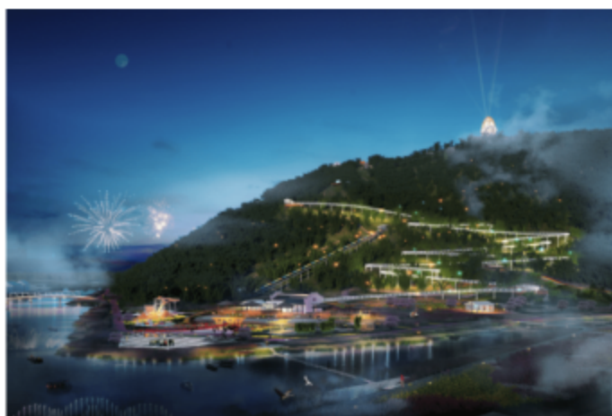
绽放的灵山江·灵溪竹海项目