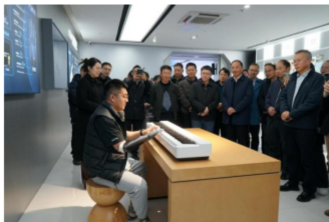
集团党员干部实地参观国内脑机接口领域的领军企业浙江强脑科技公司