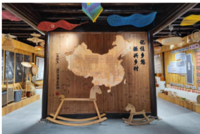
“一盒故乡”共富工坊