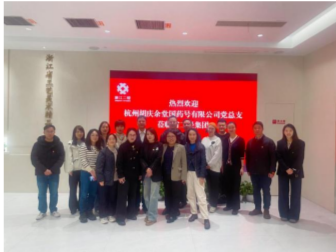
经营部党支部与胡庆余堂党总支开展“赓续传承 守正创新”党建联建