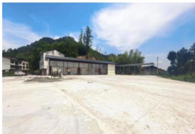
洞子村李子集散仓库建设

扎实推进东西部协作任务，定点帮扶四川宣汉县庙安镇洞子村，协助村集体流转土地，建成标准化脆李示范园，持续增强当地造血功能与发展后劲，助力村集体经济收入稳步提升。