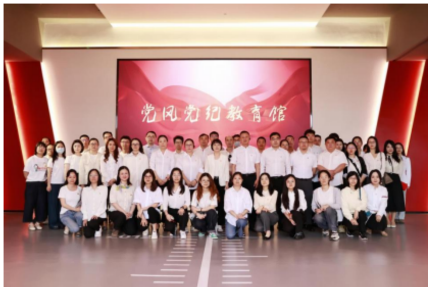
集团所属工艺品公司党委和艺创文旅公司党支部参观党风党纪教育馆