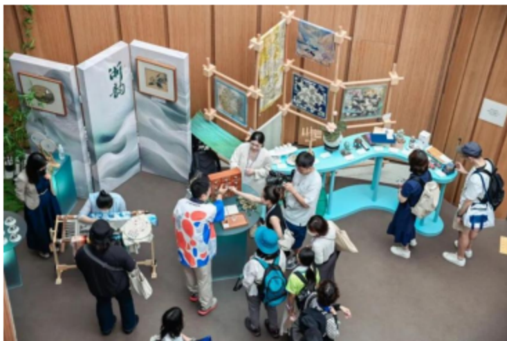
“万年赓续·翠叠江南”浙江历史经典产业展