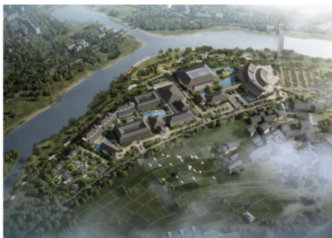
南雁荡山文化旅游片区

以工美文化为内核，高标准推进重大文旅项目。南雁荡山文化旅游片区开发项目聚焦多产业融合发展，核心策划、业态建设、招商运营同步推进；“绽放的灵山江·灵溪竹海”项目深度融合竹文化与生态资源，新增特色文旅业态，持续夯实区域文旅产业发展基础；临平公园、良渚金家头项目竣工投运，形成可复制、可盈利的文旅融合发展模式，以文旅赋能乡村振兴与共同富裕。